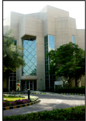
这就是中伊“同居”的B幢。

已经开始训练的中国队被俱乐部逐出了场外,肯定是几方的沟通出了问题。仔细一打听,原来是伊拉克人一厢情愿地想做个顺水人情。由于不是自己的主场,伊拉